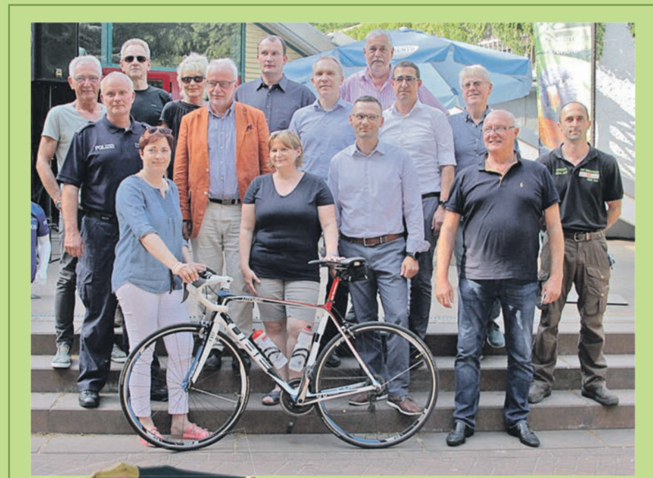
Die Sponsoren der diesjährigen Tigerradtour bei der Übergabe der neuen Trikots.

DER BLITZ UND DIE HIER INSERIERENDEN UNTERNEHMEN WÜNSCHEN ALLEN TEILNEHMERN DER TIGERRADTOUR VIEL ERFOLG!